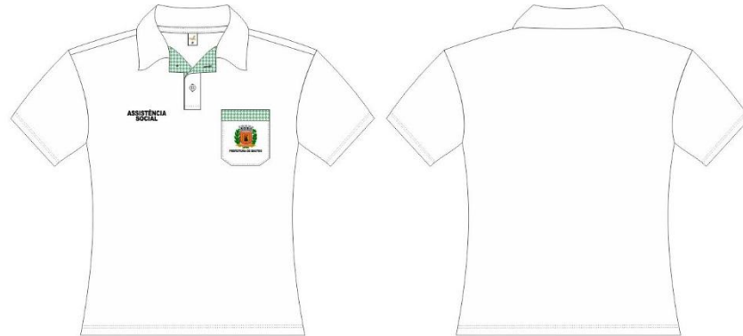
Itens 5 e 6

CNPJ 45.547.403/0001-93 FONE/FAX 14/3478-9800